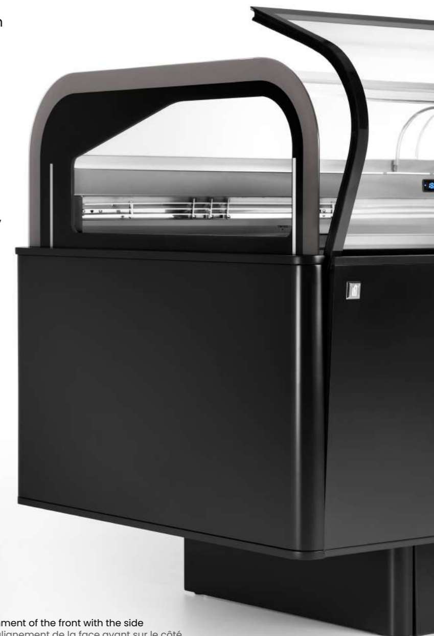
Elegant line: alignment of the front with the side Ligne élégante : alignement de la face avant sur le côté