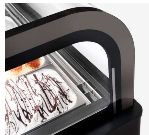
Concealing air Reprise de l'air cachée

Dans Esedra, le système de réfrigération ventilée avec double évaporateur, le flux d'air en hauteur et les technologies exclusives d'Ifi , comme le système HCS, protègent la qualité de vos aliments, en réduisant la consommation d'énergie et en protégeant l'hygiène. HCS (Hi-Performance Closure System) : le système de fermeture arrière à haute performance détecte le temps réel d'ouverture de service, réduisant le dégivrage au minimum nécessaire, avec des avantages importants pour la qualité de la glace, l'efficacité énergétique et l'hygiène . Dans la version HCS PRO (avec panneau), l'isolation thermique est encore plus performante. Dans le service Pâtisserie , le système de réfrigération garantit une humidité idéale de 70%. La Chocolaterie Esedra , équipée d'un système de contrôle de l'humidité, peut être convertie en service de Pâtisserie.