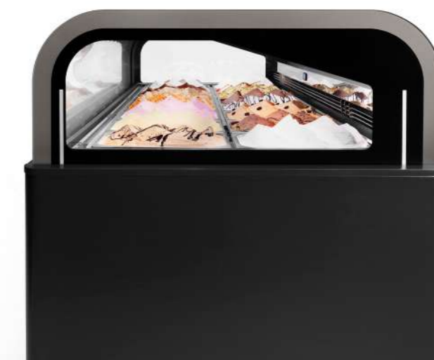
Horizontal and raised top Dessus horizontal et surélevé

In Esedra, the ventilated refrigeration system with double evaporator, the overhead airflow and exclusive Ifi technologies such as the HCS system protect the quality of your food, reducing energy consumption and protecting hygiene. HCS (Hi-Performance Closure System) : the high-performance rear closure system detects the actual opening time of the showcase, minimizing defrost cycles, with significant benefits for gelato quality, energy efficiency, and hygiene . In the HCS PRO version (with panel), thermal insulation is even more efficient. In the Pastry service , the refrigeration system guarantees the ideal humidity of 70%. Esedra Praline , equipped with humidity control, can be converted to a Pastry service.